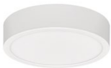
90 Blanco Técnico / Technical White / Blanc Technique