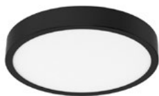
01 Negro / Black / Noir